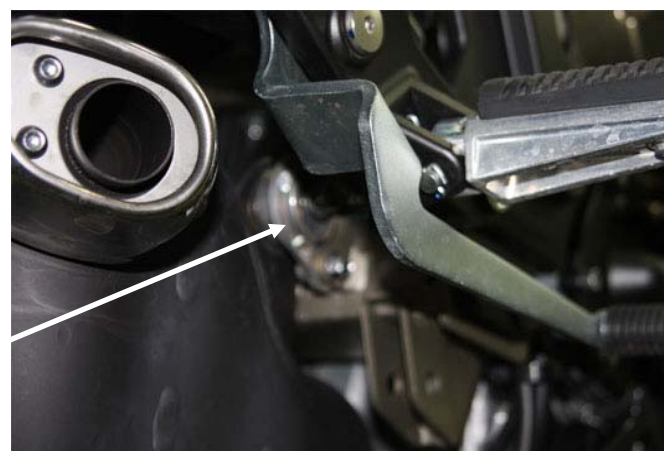
Dopo aver svitato le flangie rimuovere tutto il blocco del terminale originale attraverso le 2 viti Unscrew the screws shown above and remove the whole exhaust system