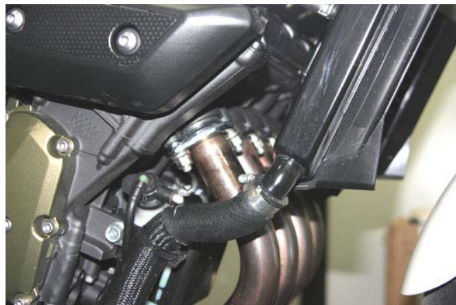
Svitare le flangie al cilindro Unscrew the screws fixing the flanges to the cylinders