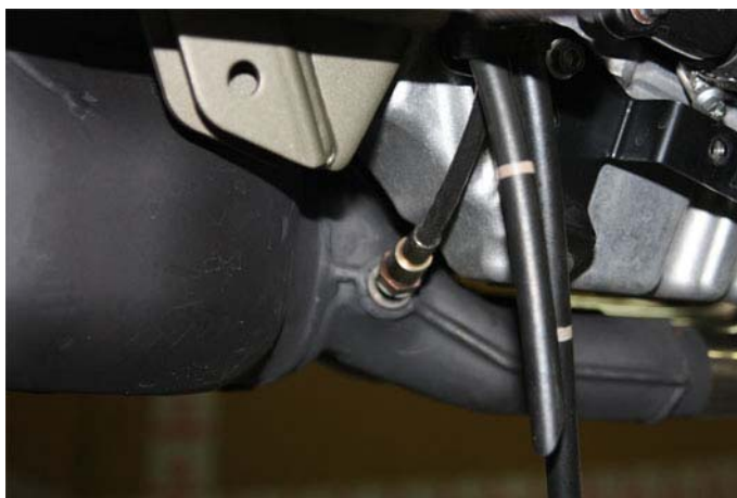
Svitare la sonda lambda Unplug the oxygen sensor